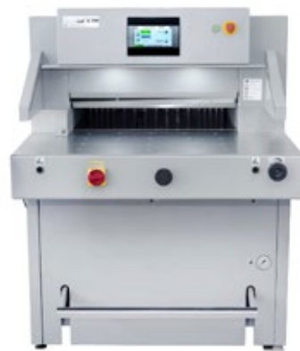
Kuvassa Grafcut 73H