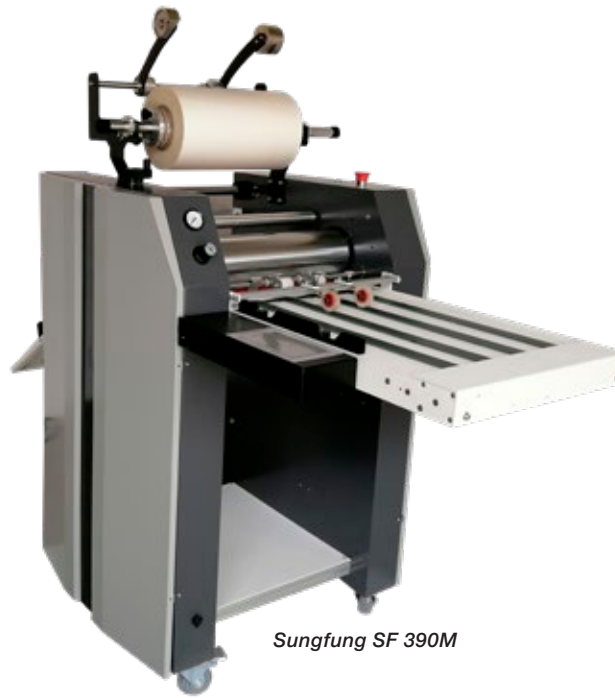
Sungfung SF 390M

Laaja laminaattivalikoima digi- ja offset-tuotantoon. Laminaatit rullissa, eri leveyksin ja pituuksin. Nopeat toimitukset tai noudot kotimaisesta varastostamme. Hyllyssä myös erikoislaminaatteja, kuten samettinen soft touch ym. Pyydä hinnasto jossa tuotantokuluesimerkit!