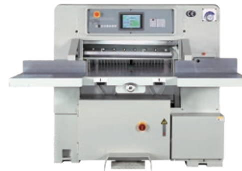
Kuvassa LG 720

Katso myös LG leikkausjärjestelmät ja erikoisleikkurit: www.longer-machine.com