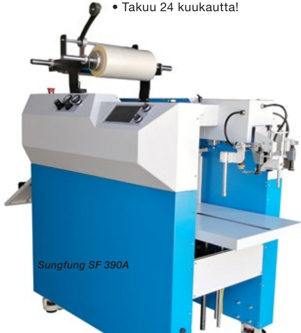
Sungfung SF 390A